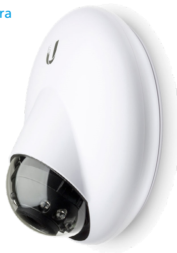
Unifi Indoor/Outdoor Camera Dome