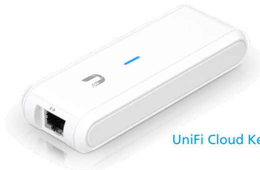
UniFi Cloud Key