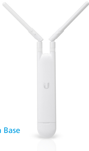
UniFi Mesh Base

Das Netzwerk kann administrativ in ein virtuelles Mitarbeiternetz und ein separates Kundennetz aufgeteilt werden, welches über ein Ticketsystem und variable Bandbreitenanpassung an das Angebotsmodell des Hotels angepasst werden kann.