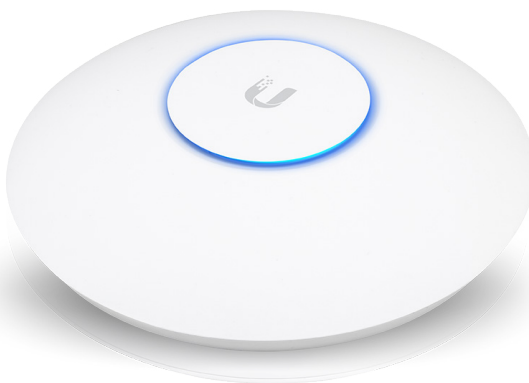
UniFi Access Point