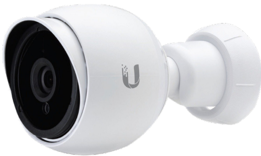
Unifi IP Überwachungskamera

Die Arconda Systems AG ist für eine Vielzahl von kleinen und mittelständischen Unternehmen als externer Datenschutzbeauftragter bestellt. Unsere technische Expertise stellt sicher, dass IT-seitige Machbarkeit und rechtliche Möglichkeiten ineinander greifen.